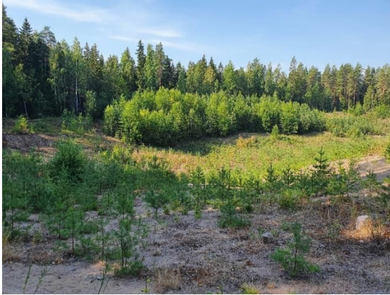
Kuva 13-3. Maisemoitu loivarinteinen maa-ainekuoppa M3.