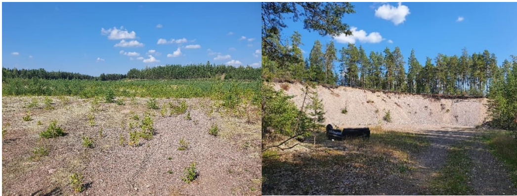
Kuva 16-1. Hinkalonnummen vanha laaja ja maisemoitu maa-ainesalue M1 (vas) ja sen eteläosan kotitarvekuoppa sohvineen (oik).

Laajin vanha maa-ainesalue on kohde M1 pohjavesialueen eteläosassa Hinkalonnummella. Alue on maisemoitu, ja sen eteläosassa on aktiiviselta vaikuttava jyrkkärinteinen kotitarvekuoppa, jonne on viety sohvia (Kuva 16-1). Muilta osin Rajamäen maa-aineskuopilla ei havaittu roskaantumista.