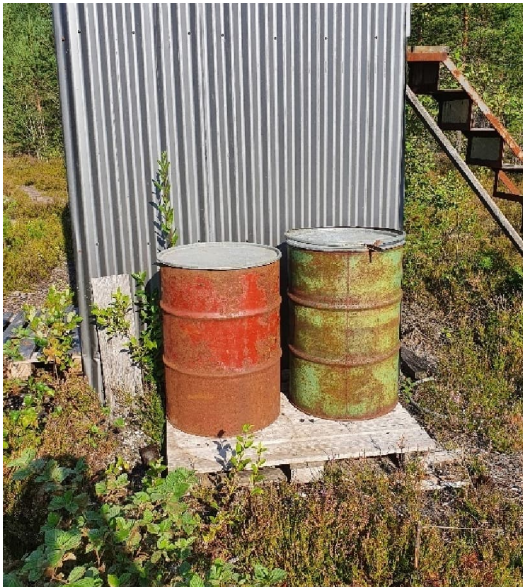
Kuva 17-2. Tynnyreitä alueella M3.

Pieniä kotitarveottokuoppia on pohjavesialueen luoteisosassa Vihtijärven rannan läheisyydessä (M5, M6 ja M7), Vihtilammin koillispuolella (M8, Kuva 17-3) ja Sääksjärven eteläpuolella vanhan kaatopaikan alueella (M9, Kuva