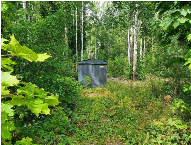
Kuva 15-1. Puistomuuntamo Nummenpään pohjavesialueella.

Muuntamoiden pohjavedelle aiheuttama riski on arvioitu erittäin merkittäväksi. Riskiä nostaa Nummenpään vedenottamolla sijaitseva pylväsmuuntamo.