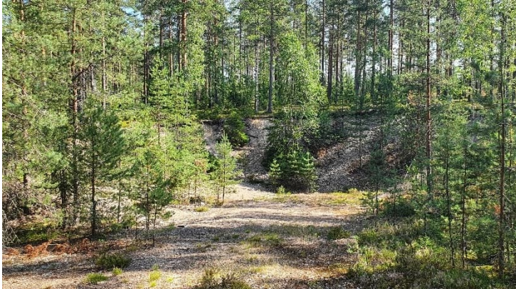
Kuva 17-3. Kotitarvekuoppa M8 Vihtilammin koillispuolella.

17-4). Kuoppien M5 (Kuva 17-5) ja M6 (Kuva 17-6) läheisyydessä varastoidaan puutavaraa ja/tai metallirullakoita ja kuopalla M7 (Kuva 17-7) on hieman roskaantumista.