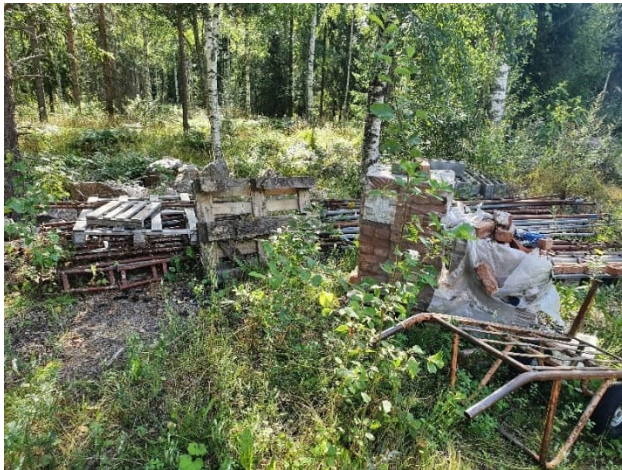
Kuva 10-1. Kohteen R4 alueella säilötään metsässä puu- ja metallitavaraa.

Asuin- ja teollisuuskiinteistöjen piholla säilytettävät kemikaalit, haitalliset aineet, romut ja jätteet muodostavat riskitarkastelun perusteella vähäisen riskin pohjavedelle.