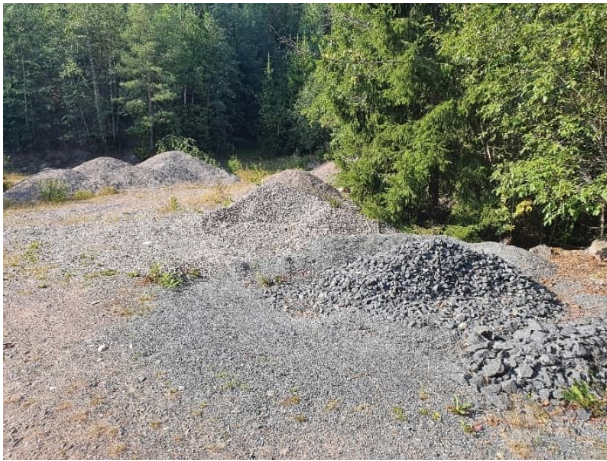
Kuva 13-4. Vanha kotitarvekuoppa M4, jossa varastoidaan pieniä seulottuja maa-ainekasoja.