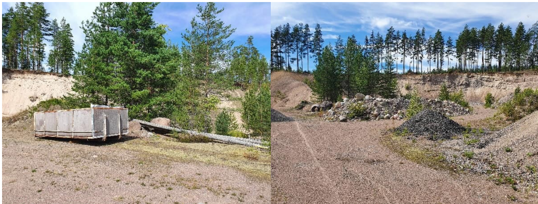
Kuva 15-2. Nummenpään maa-aineskuoppa M1.

Pohjaveden muodostumisalueella on vanhoja maa-ainesalueita sekä nykyisiä kotitarveottokuoppia. Kohde M1 (Kuva 15-2) on osittain maisemoitu vanha maa-aineskuoppa, jossa on edelleen maa-ainekasoja ja metallilava. Kohde on vielä kotitarveotto toiminnassa. Myös kohteella M4 (Kuva 15-3) on kotitarveottoa, ja alueella on seulontakone sekä kiviainekasoja. Kohteet M2 ja M3, sekä M5 ja M6 (Kuva 15-4) ovat pienempiä kotitarvekuoppia.