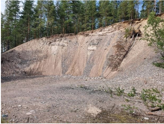
Kuva 21–1. Kotitarveottokuoppa vanhan maa-ainesalueen M1 pohjoisosassa.

ainesalueen M1 aluerajaus on arvioitu ilmakuvan perusteella. M1-alueen pohjoisosassa on jyrkkärinteinen kotitarveottokuoppa (21–1).