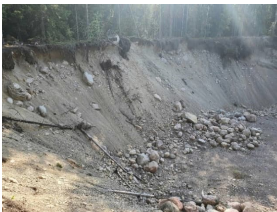
Kuva 13-2. Maa-ainekuoppa M2, jossa harjoitetaan kotitarveottotoimintaa.

Kohde M2 on maisemoimaton ja jyrkkärinteinen kuoppa, jossa harjoitetaan kotitarveottoa (Kuva 13-2). Kuva 13-3 on kuva luiskatusta ja maisemoidusta kuopasta M3. Kohteessa M4 varastoidaan pieniä seulottuja maa-aineskasoja (Kuva 13-4). Pohjavesialueella on pieni, mahdollisesti kotitarveottoon käytettävä, maa-ainekuoppa M5 Einolankujan varrella.