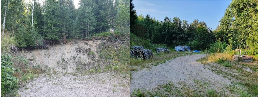
Kuva 17-6. Kuopan M6 (vas.) lähistöllä varastoidaan puutavaraa (oik.).