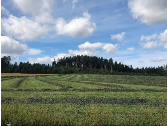
Kuva 19-1. Näkymä Peltolantieltä Ali-Labbartin luoteisosan muodostumisalueelle.