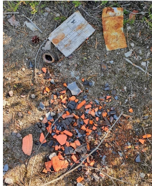
Kuva 17-1. Ampumarata maa-ainesalueella M3. Alueella on paljon savikiekon palasia (oik.)