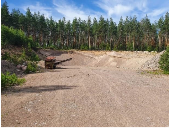
Kuva 15-3. Nummenpään maa-ainekuoppa M4.