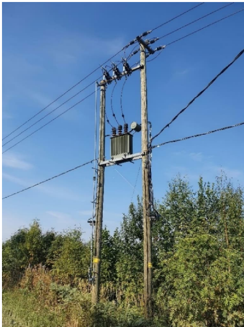
Kuva 13-1. Pylväsmuuntamo Penttiläntien varrella.

Muuntamoiden pohjavedelle aiheuttama riski on arvioitu merkittäväksi.