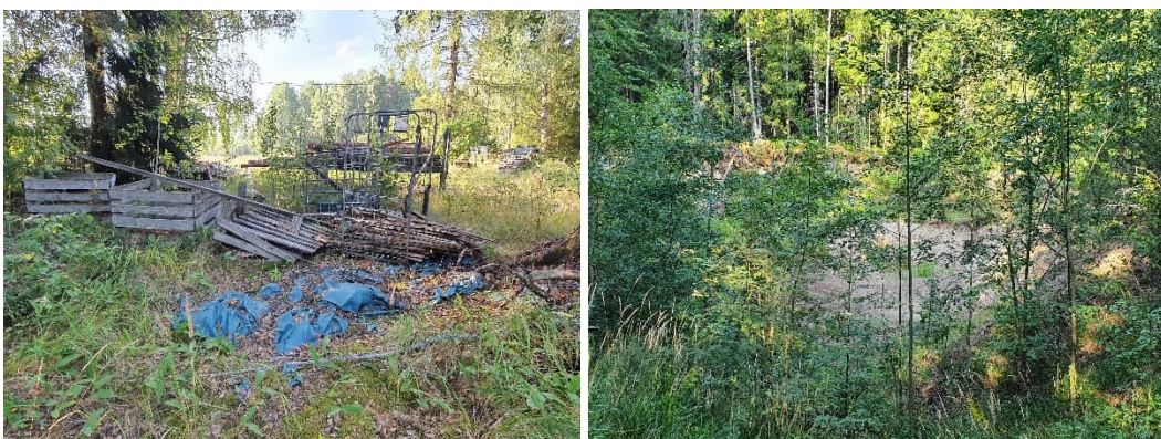
Kuva 17-5. Rullakoita ja puutavaraa (vas.) kuopan M5 (oik.) lähistöllä.