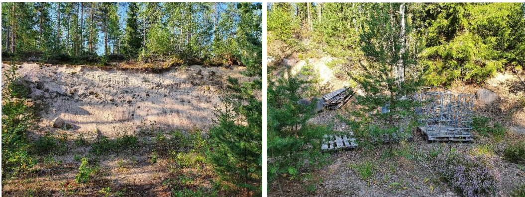
Kuva 17-7. Rullakoita ja puutavaraa (oik.) kuopan M7 (vas.) lähistöllä.