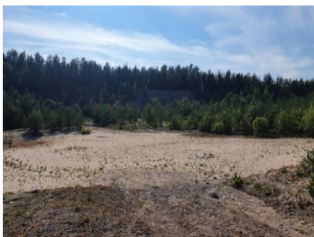
Kuva 16-2. Maa-ainesalue M4.

Herustenjärvien koillispuolella Hyvinkäänkylässä sijaitsee kaksi vanhaa ottoaluetta (M3 ja M4). Kuoppa M4 on aukea, reunoilta maisemoitu alue (Kuva 16-2).