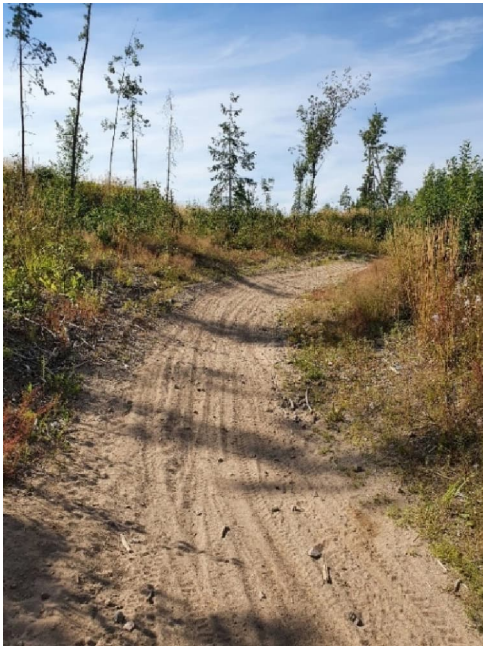
Kuva 10-3. Raalan hiekkamontulla olevia maastoajelun jälkiä.

Valkoijan vedenottamon suoja-aluepäätöksessä on kirjattu kaukosuoja-alueen osalta maaleikkausten tekoon liittyen seuraavaa: Sellaisten maaleikkausten tekemisestä, jotka saattavat ulottua yhtä metriä lähemmäksi ylintä pohjaveden pintaa on hyvissä ajoin ennen työhön ryhtymistä ilmoitettava Helsingin vesipiirin vesitoimistolle ja Nurmijärven kunnalle. Kunnalla on oikeus antaa työn suorittamista koskevia ohjeita, kunnes vesioikeus hakemuksesta mahdollisesti toisin määrää. Nurmijärven kunnalla on oikeus kustannuksellaan täyttää ylimmän pohjavedenpinnan alapuolelle ulottuvat avoimet kaivannot. Lisäksi lähisuojaväyhykkeellä: ilmoitusvelvollisuus koskee maaleikkauksia, jotka saattavat ulottua kahta metriä lähemmäksi ylintä pohjaveden pintaa.