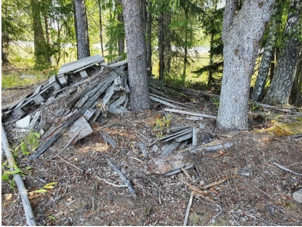
Kuva 10-2. Raalan hiekkamontulla roskaantumista.

kasvattaa se pohjaveden pilaantumisen riskiä esimerkiksi onnettomuus- ja vuototilanteissa.