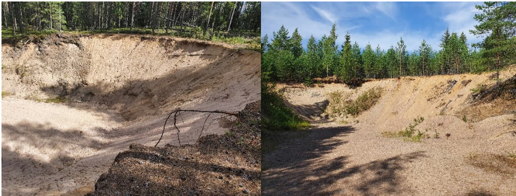
Kuva 15-4. Nummenpään kotitarvekuopat M5 (vas.) ja M6 (oik.).