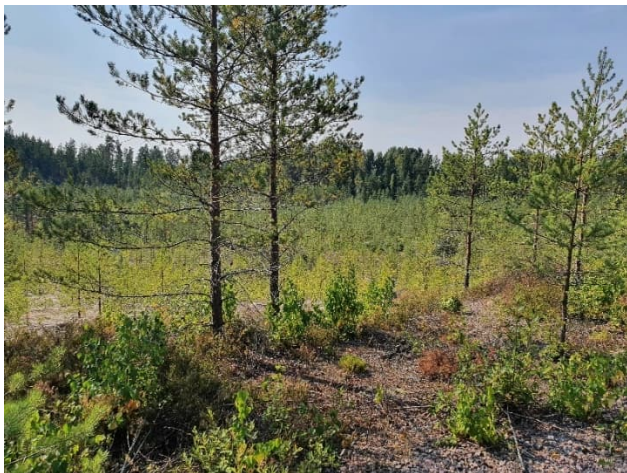
Kuva 12-2. Vanhaa maisemoitua maa-ainesaluetta M3 alueen itäosasta kuvattuna.