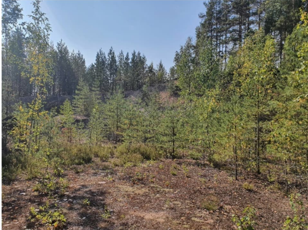
Kuva 12-1. Vanhaa maisemoitua maa-ainesaluetta (M1) Nukarin puolella.