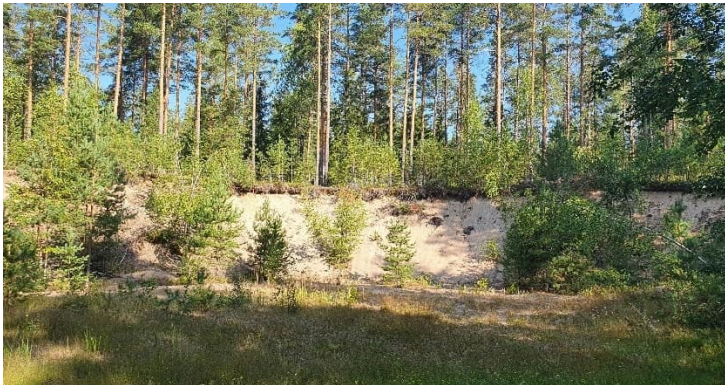
Kuva 17-4. Kotitarvekuoppa M9 Sääksjärven eteläpuolella vanhan kaatopaikan alueella.