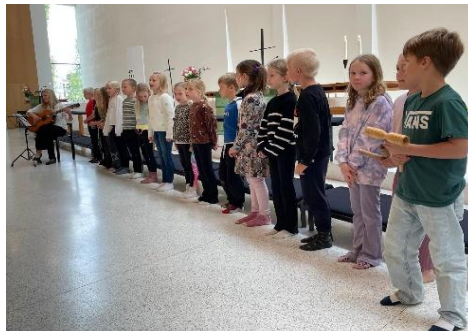
Vanhustenviikon juhla Klaukkalan kirkossa 7.10.2024