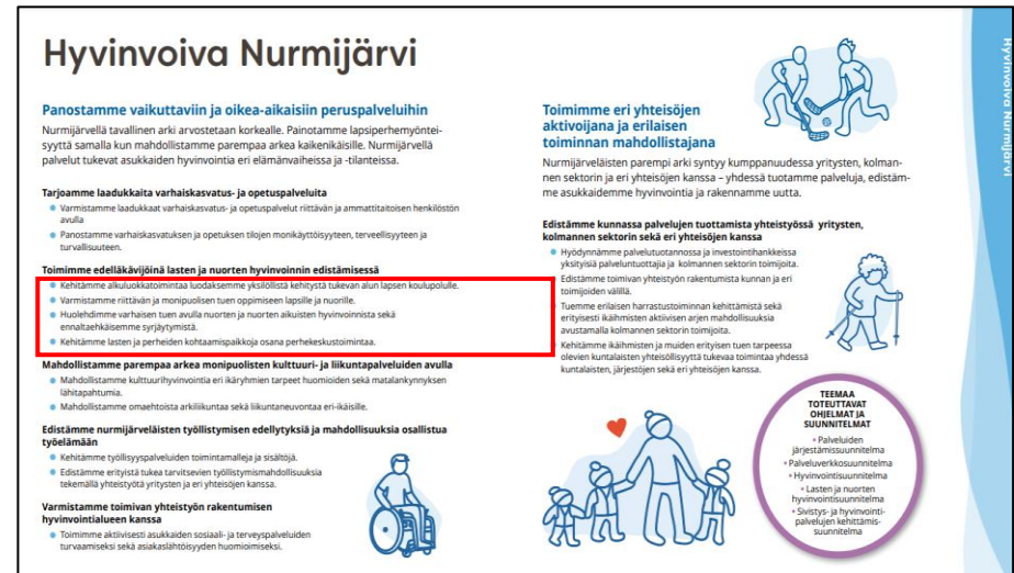
Kuva 1. Kunnan visiota Nurmijärvi - paremman arjen ilmiöt ä tavoitellaan kolmen teemakokonaisuuden (hyvinvointi, asuminen, elinkeinot) ja näitä toteuttavien kuuden painopisteen kautta. Kutakin teemakokonaisuutta ja edelleen painopistettä toteutetaan tarkempien toimenpiteiden kautta (oikeanpuoleinen kuva punainen laatikko).