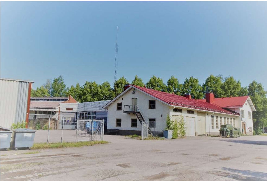
Kuva 5: Vanhan sähkölaitoksen rakennuskokonaisuus.

Suunnittelualueella olevien rakennusten purkamisesta vastaa Nurmijärven kunta.