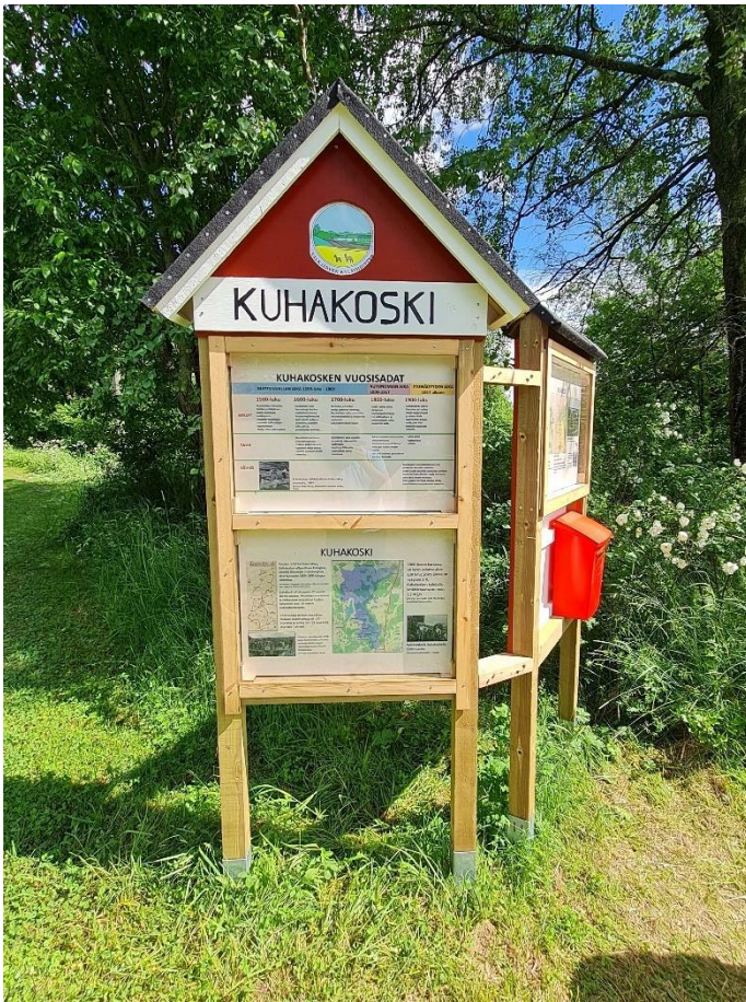
Liite 1, Valkjärven kyläyhdistyksen toteuttamat opastaulut