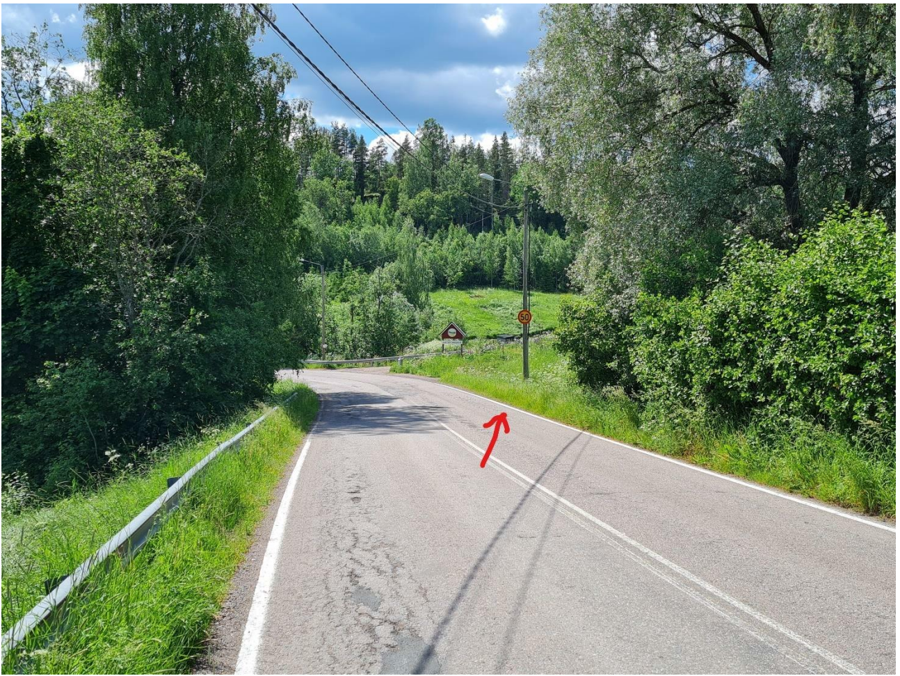
Liite 5, kohta, jossa nopeusrajoitus voisi vaihtua