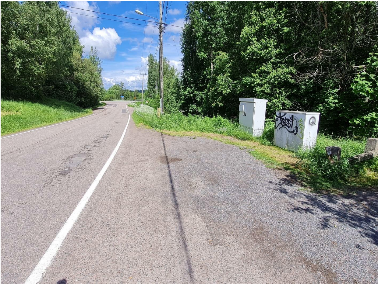
Liite 3, nykyisin käytössä oleva liikenteen kannalta häiriötön pysäköintialue kuvattuna Valkejärventieltä