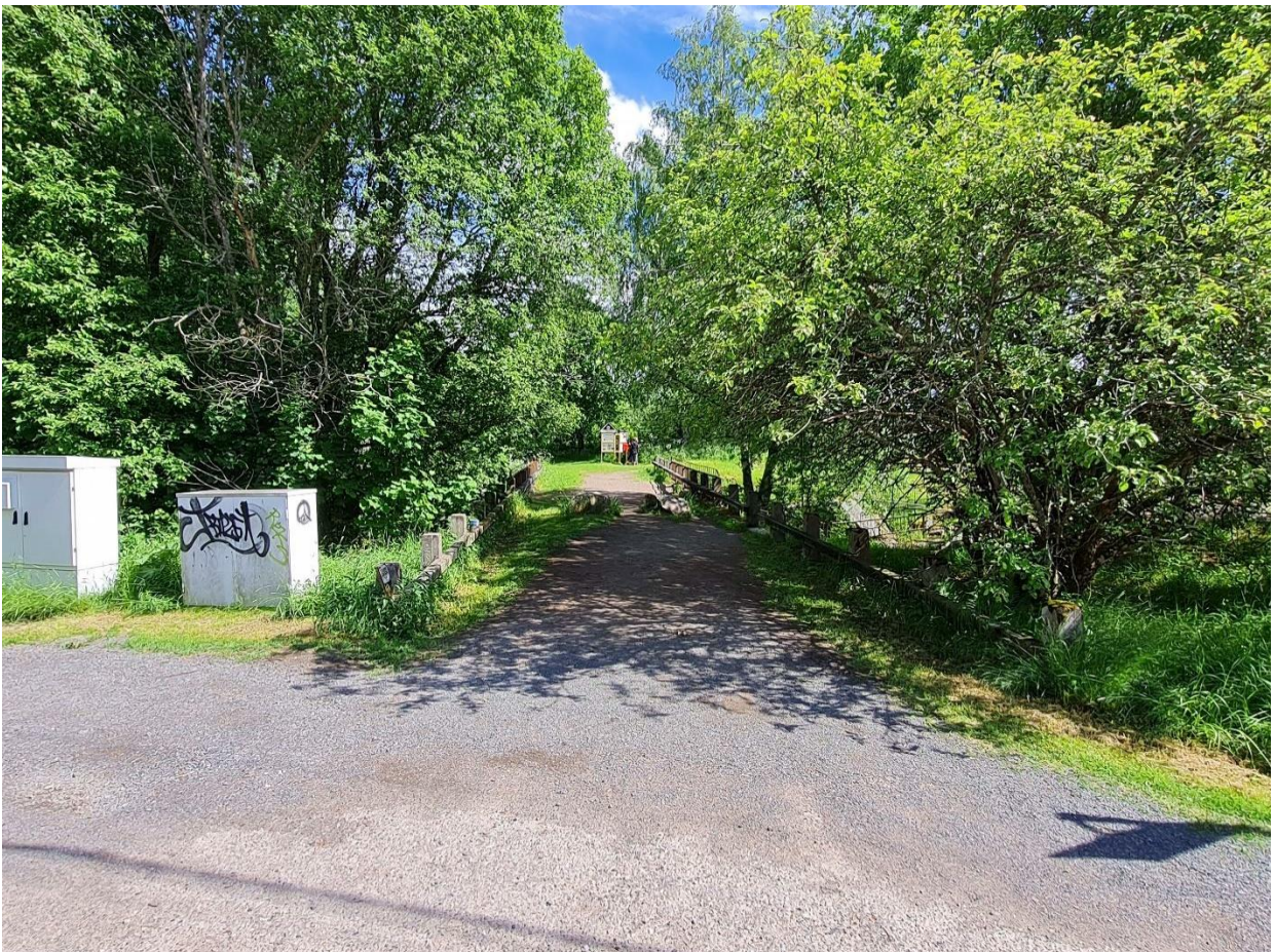
Liite 4, nykyisin käytössä oleva liikenteen kannalta häiriötön pysäköintialue kuvattuna Sahamäen tieltä.