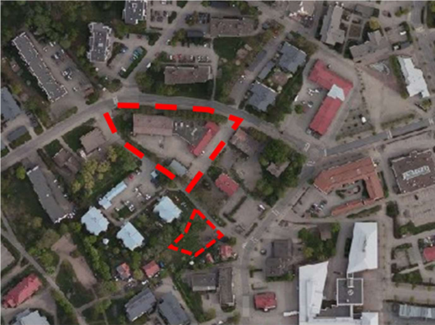
Kuva: Ilmakuva kilpailukohteesta, joka käsittää k2028t5 ja k2030t7.

Alueen rakennukset ovat osittain vajaalla käytöllä, elinkaarensa loppupuolella tai niissä tapahtuvaa toimintaa ollaan siirtämässä muualle.