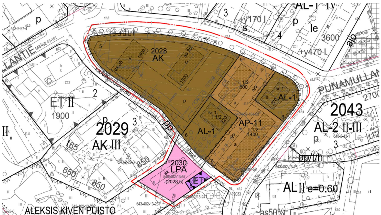
Kuva: Asemakaavaluonnos, vaihtoehto C.

Asemakaavan suunnittelu käynnistettiin Nurmijärven kunnan aloitteesta (Asemakaavoitus- ja rakennuslautakunnan päätös asemakaavan laatimisen vireilletulosta 25.9.2018 § 79). Kaksi asemakaavaluonnosta pidettiin nähtävillä 14.5.-15.6.2020. Näistä vaihtoehto C valittiin jatkokehityksen pohjaksi. Kilpailu perustuu vaihtoehtoon C (kuva). Tämä hakumenettely koskee vain osaa kaavamuutosalueesta.